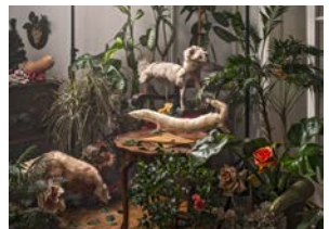
Diósi Máté, Visszatérés a természethez 01, 2020 Diósi Máté, Visszatérés a természethez 02, 2020 Diósi Máté, Visszatérés a természethez 03, 2020 Diósi Máté, Visszatérés a természethez 06, 2020