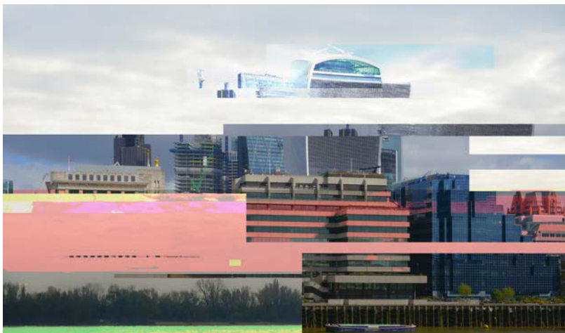
Szabó Kristóf - KristofLab, Before After II., Wrong Data sorozatból, 2018 Szabó Kristóf - KristofLab, Before After III., Wrong Data sorozatból, 2018