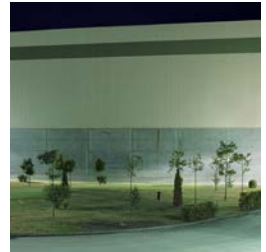
Martinkó Márk, Mesterséges zöld No. 21, 2017 Martinkó Márk, Mesterséges zöld No. 29, 2017 Martinkó Márk, Mesterséges zöld No.14, 2017 Martinkó Márk, Mesterséges zöld No.13, 2017