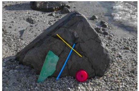
Csizik Balázs, Hulladék szuprematizmus n1, 2019 Csizik Balázs, Hulladék szuprematizmus n5, 2019 Csizik Balázs, Hulladék szuprematizmus n6, 2019