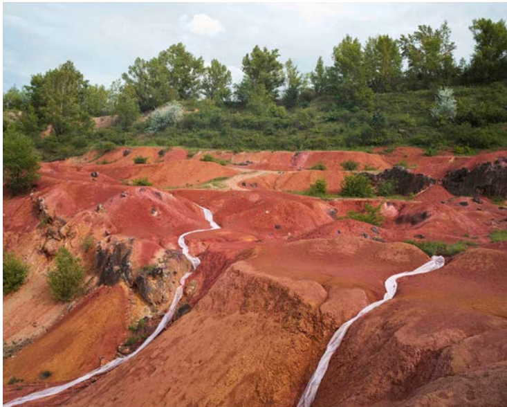
Rétfalvi Soma, PACK, 2016 Rétfalvi Soma, PACK, 2016